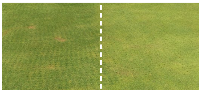
Prato trattato con BioAgenasol® profigreen, dopo due settimane.