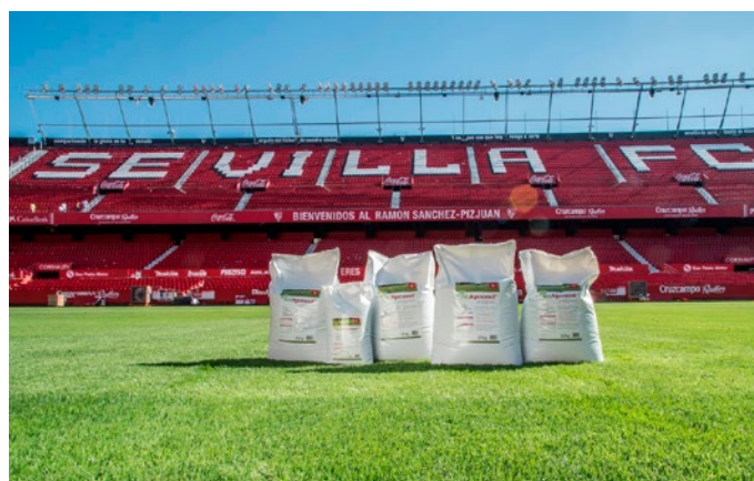
FC Sevilla si affida a BioAgenasol® profigreen per ottenere il miglior manto erboso.