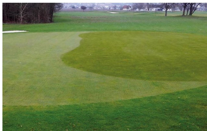
A destra, condensa visibilmente ridotta con BioAgenasol® profigreen rispetto all'area di sinistra non trattata con BioAgenasol® profigreen.

BioAgenasol® profigreen deve le sue grandi proprietà di dispersione alla sua speciale granulometria (0,2–2 mm). Per un risultato ottimale, si applichi in modo uniforme con uno spandiconcime.